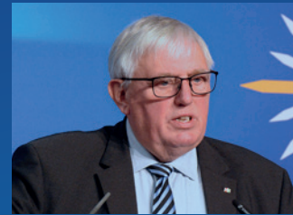
Karl-Josef Laumann, MdL Minister für Arbeit, Gesundheit und Soziales des Landes Nordrhein-Westfalen