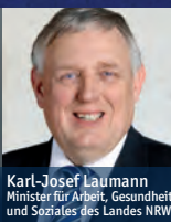
Karl-Josef Laumann Minister für Arbeit, Gesundheit und Soziales des Landes NRW