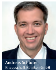
Andreas Schlüter Knappschaft Kliniken GmbH